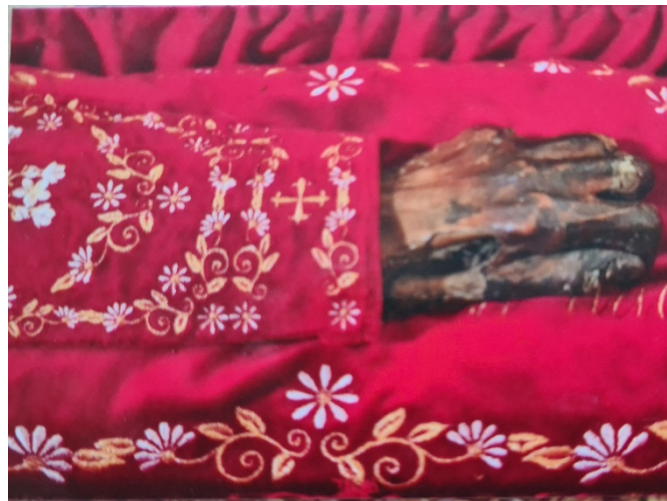
Рука Светог Саве, Манастир Милешева

„ ..величина немањићке епохе умногоме је можда Савина заслуга, али да је морал, високи морал кроз векове највећег дела нашег народа, светла сен те руке над нама сачувала, то је чињеница јасна и извесна“