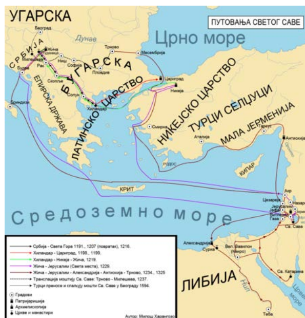
Два Путовања Светог Саве Јерусалим 1229 и 1234.

У току развоја, радионице су обогачене коришћењем и варијанти метода друштвеног сањања, скицирања и цртања, интер-групних догађаја... временом се то пренело и на остале радионице широм света.